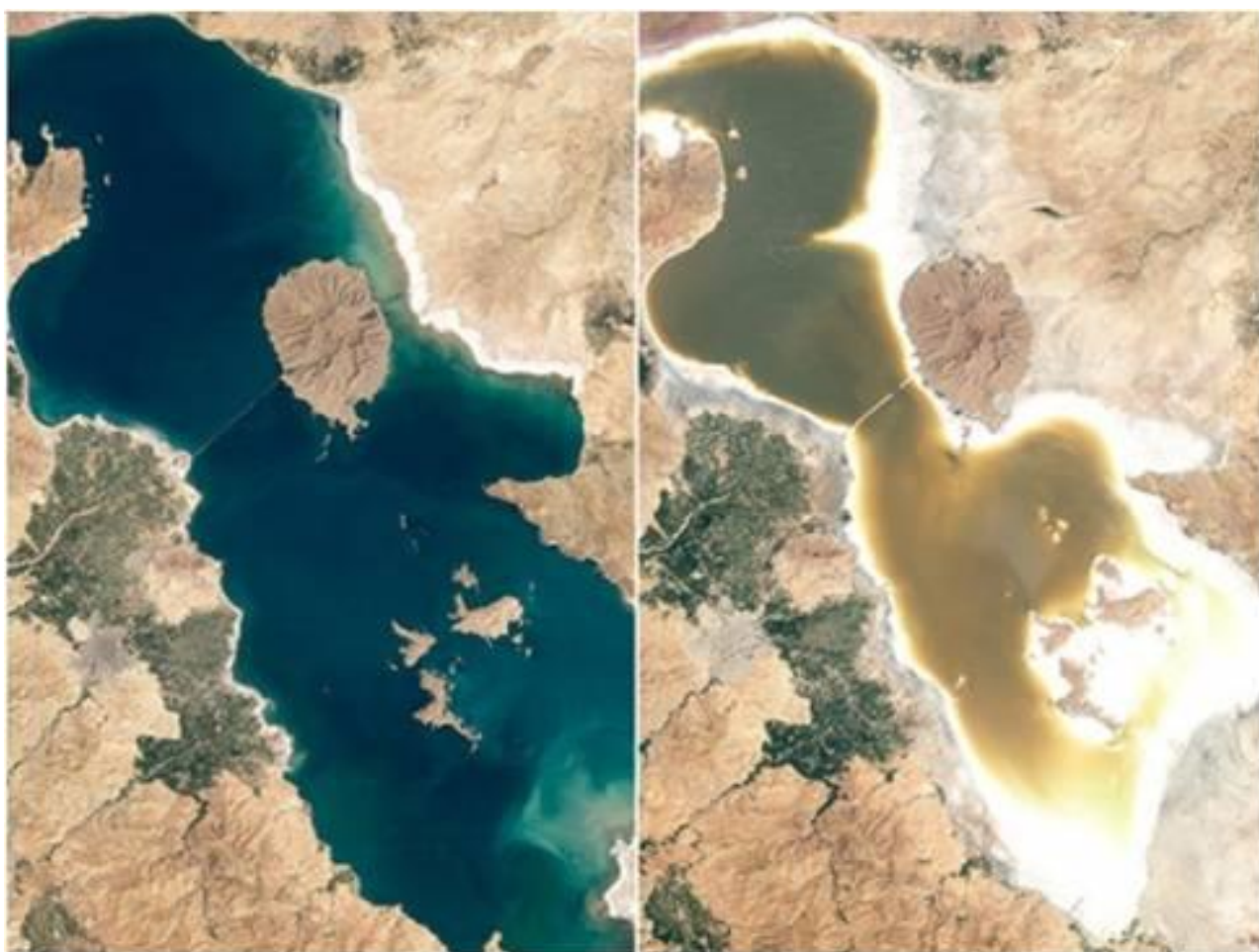
اثرات تغییر اقلیم بر اکوسیستم طبیعی دریاچه ارومیه